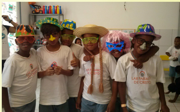
A Festa das Crianças contou com adereços que foram sucesso com a garotada