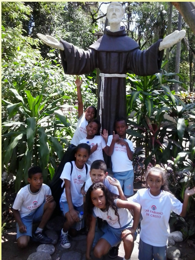
No Zoológico do Rio as crianças posaram para fotos com a imagem de Francisco de Assis

Para as crianças, além da convivência, ficou a lembrança deste momento de muita diversão e alegria.