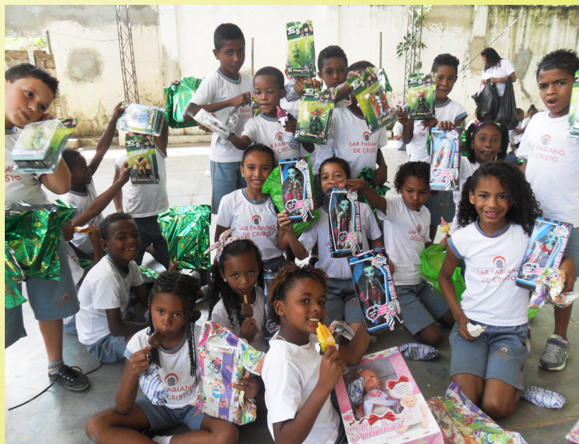
A ação "Um dia de brinquedo" trouxe a alegria de se sentir querido e lembrado