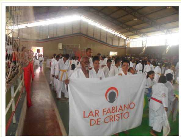
Equipe de Karatê Interestilos da Casa de Eugênia

A equipe de Karatecas do Lar Fabiano de Cristo – Casa de Eugênia – Salvador/BA, com dedicação e muito treino, teve uma participação exemplar, conquistou ótimas pontuações e touxe várias medalhas para a Casa.