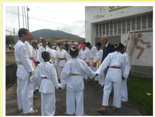
Momento de concentração na equipe